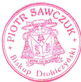
+ Piotr Sawczuk Biskup Drohiczyński