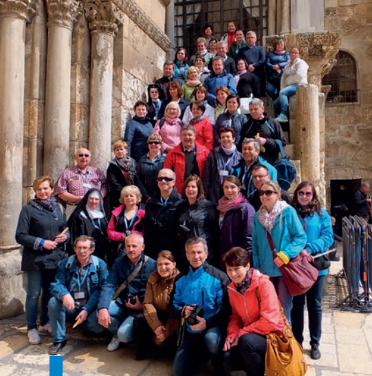
Jerozolima, Bazylika Grobu Bożego