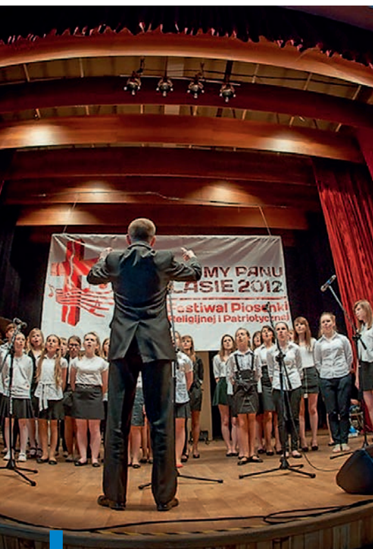
Festiwal Piosenki Religijnej „Śpiewajmy Panu”