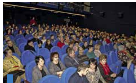
Sokołowski Ośrodek Kultury wypełniony był po brzegi