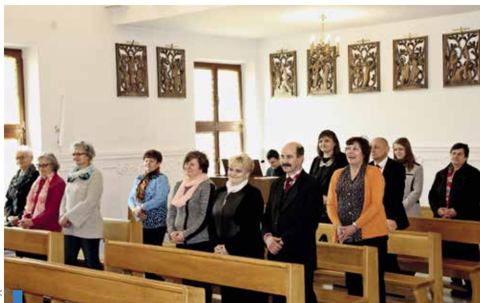
Członkowie „Civitas Christiana” uczestniczyli w Eucharystii w kaplicy WSD