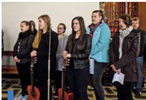
Kontemplacji przed Najświętszym Sakramentem towarzyszył śpiew zespołu

Drugi dzień wspólnie przeżywanej odnowy duchowej pod hasłem: „Walcz w dobrych zawodach o wiarę” był w formie nabożeństwa pokutnego przed Najświętszym Sakramentem. Tego dnia padło wiele ważnych pytań, nad którymi każdy powinien się zastanowić i oso-