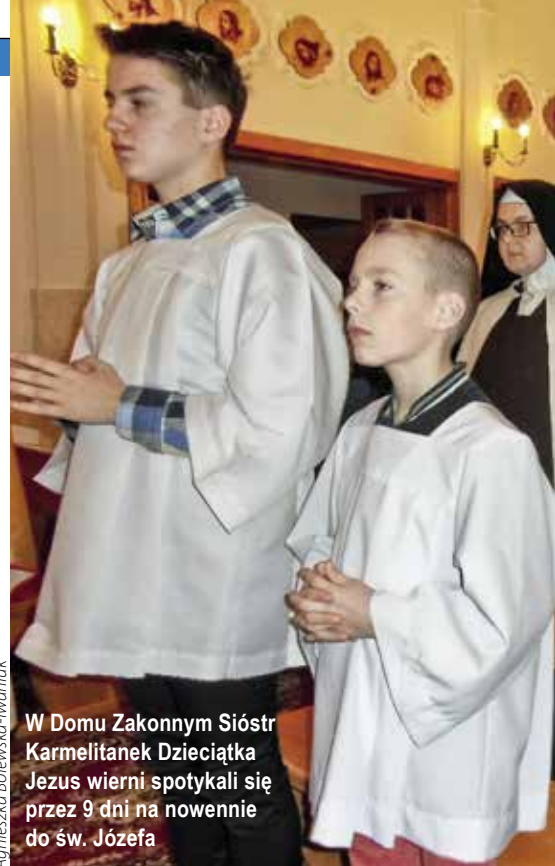
W Domu Zakonnym Sióstr Karmelitanek Dzieciątka Jezus wierni spotykali się przez 9 dni na nowennie do św. Józefa