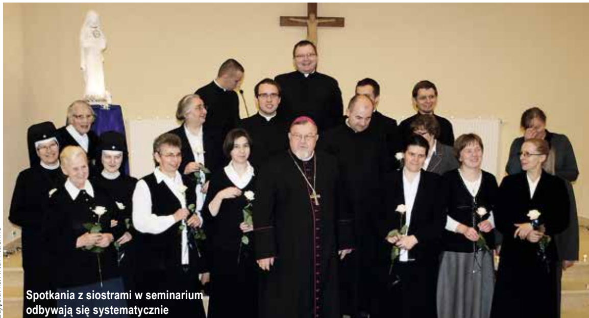
Spotkania z siostrami w seminarium odbywają się systematycznie