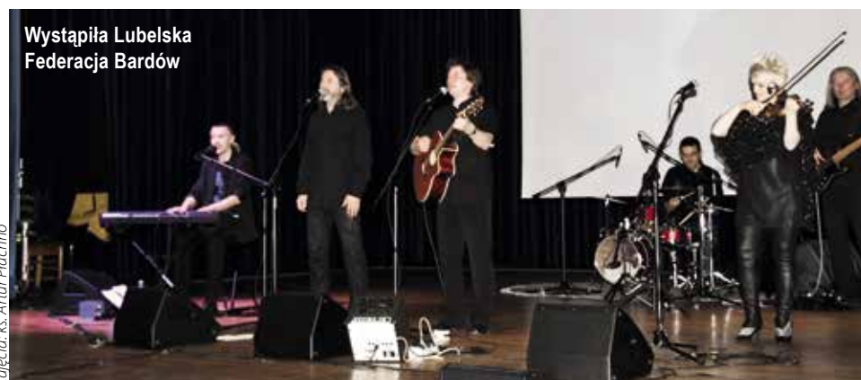
Wystąpiła Lubelska Federacja Bardów