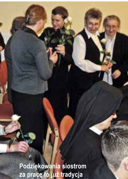
Podziękowania siostram za pracę to już tradycja