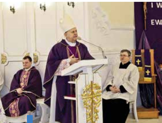
Mszy św. przewodniczył bp Tadeusz Pikus